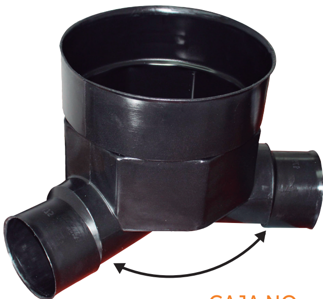
CAJA NO ALINEADA 135°/225°