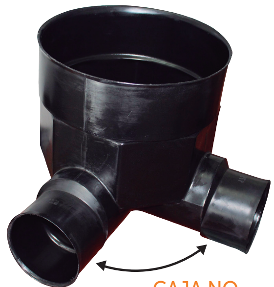
CAJA NO ALINEADA 90°/270°