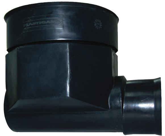
CAJA DE ARRANQUE